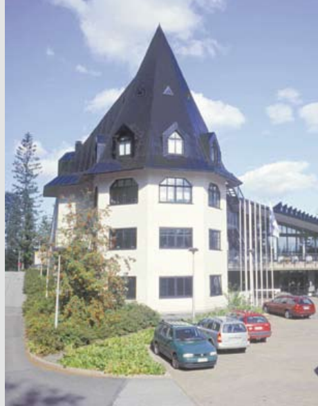
Majvik Kongressihotelli, Masala Kirkkonummi - 25 kilometriä Helsingin keskustasta.